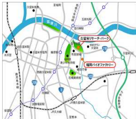
久留米リサーチパーク地図